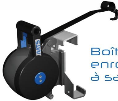
Boîtier enrouleur à sangle